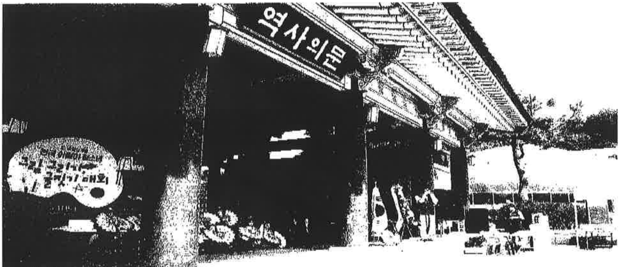
△본부석-국립5·18민주묘지 內 7번 역사의 문